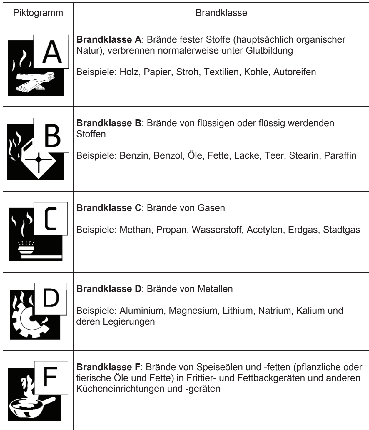
Tabelle 1: Brandklassen nach DIN EN 2 „Brandklassen“ Ausgabe Januar 2005